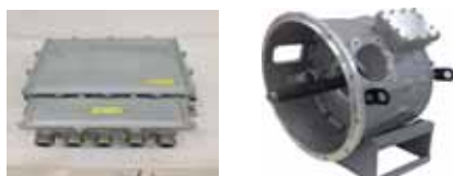
BUS-PHEV-03 型插电式动力系统电机、电控

展出产品：BUS-PHEV-03型插电式动力系统电机、电控，S15电机、电控； 吸睛技能：国际领先技术，具有高可靠性、高适应性和低维修成本