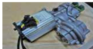
DMTDMT 低速电动汽车用交流驱动及永磁驱动电机

展出产品：AMT双100永磁同步驱动系列及交流驱动系列、DMT低速电动汽车用交流驱动及永磁驱动系列 吸睛技能：效率高、起步力矩大、成本低