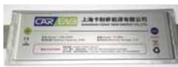
电动汽车用三元动力电池

展出产品：电动汽车用三元动力电池 吸睛技能：完整的电池包CAE分析流程保证电池系统能提供良好的防护