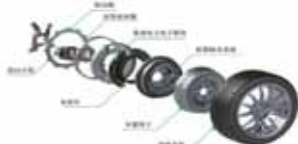
Protean Drive™ 一体化集成直驱轮毂电机系统

展出产品：轮毂电机 吸睛技能：创新设计，旋动未来；独创设计，易于集成；节能减排，优化成本