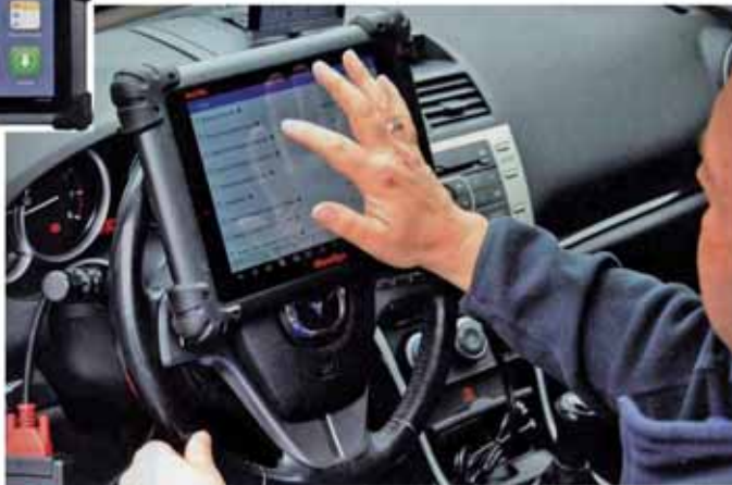
Autel 公司 Maxi Sys Pro 型故障诊断仪在安卓系统上运行，它重量轻、速度快，可以轻松的用手操作