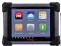
Autel 公司 Maxi Sys Pro 型故障诊断仪也可选配专用 VCI 闪存